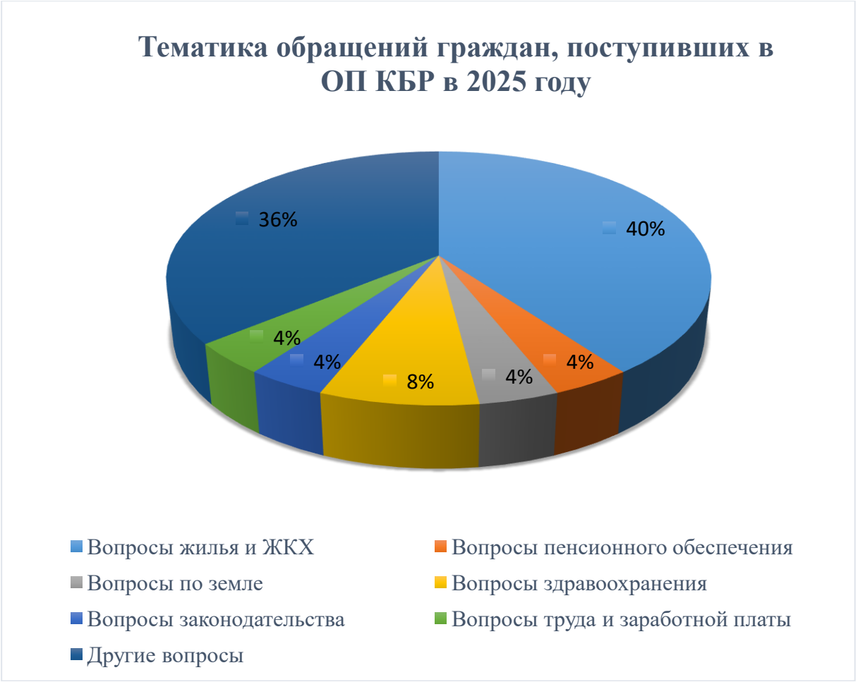
Диаграмма № 2

В целом, тематика поступивших обращений разнообразна и касается всех направлений жизнедеятельности, поэтому все комиссии ОП КБР участвуют в рассмотрении обращений граждан, направляя запросы в органы государственной власти и местного самоуправления, проводя общественные проверки. Своевременное и качественное разрешение проблем, содержащихся в обращениях, в значительной мере способствует удовлетворению нужд и запросов граждан, снятию напряженности в обществе, повышению авторитета органов власти и управления, укреплению их связи с населением.